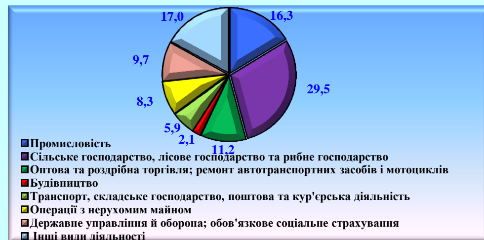
Індекси фізичного обсягу валового регіонального продукту