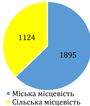
Смертність від Covid-19 за типом місцевості