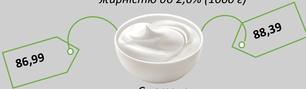
Сметана жирністю до 15% (кг)