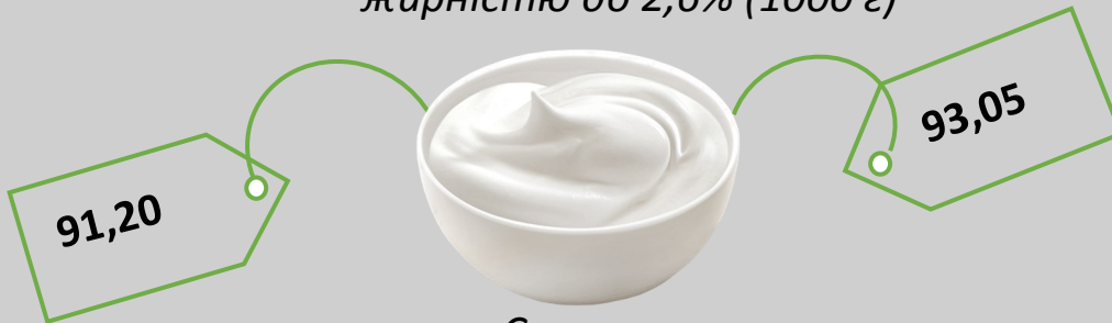
Сметана жирністю до 15% (кг)