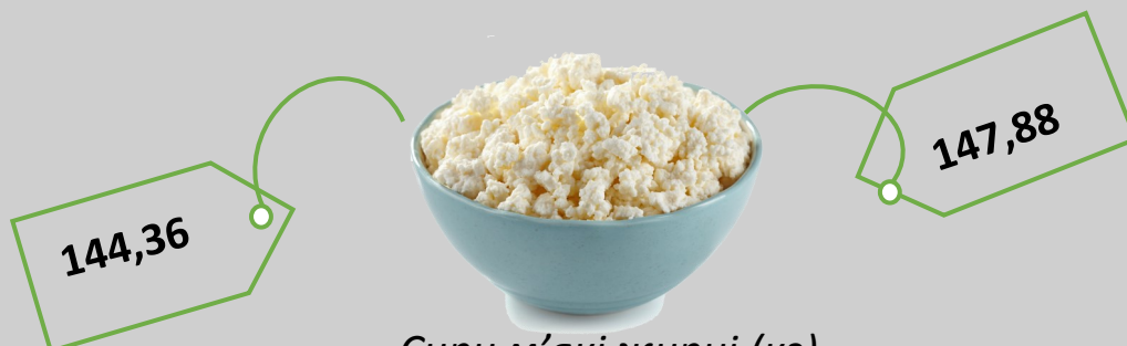
Сири м'які жирні (кг)