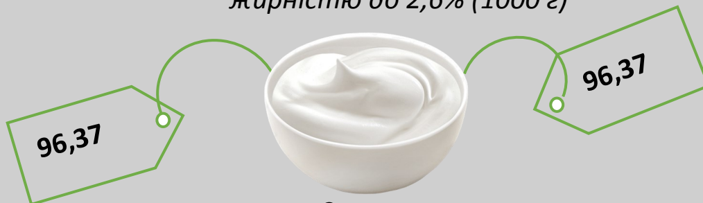
Сметана жирністю до 15% (кг)