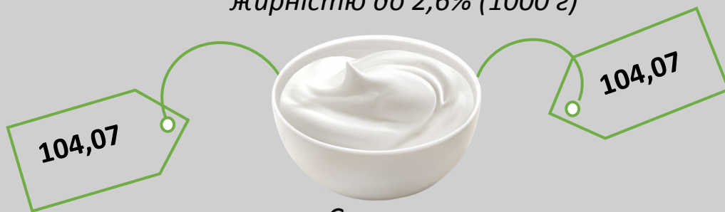
Сметана жирністю до 15% (кг)