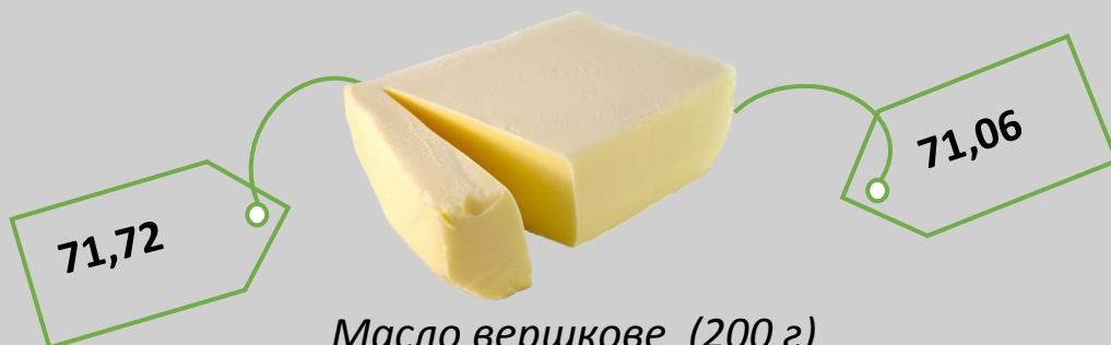
Масло вершкове (200 г)