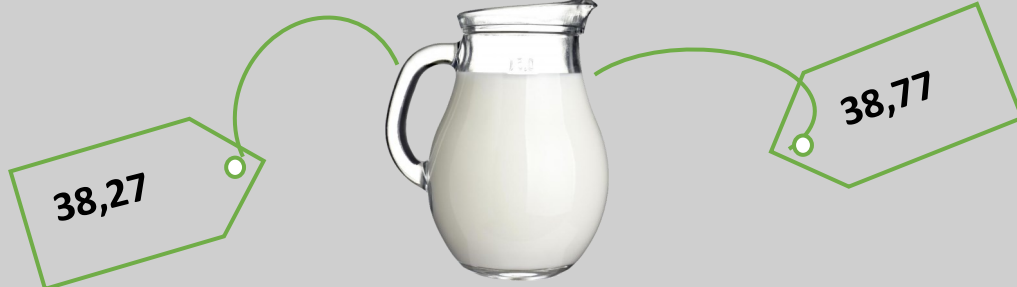
Молоко пастеризоване жирністю до 2,6% (1000 г)