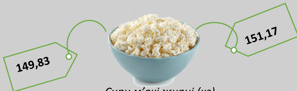
Сири м'які жирні (кг)