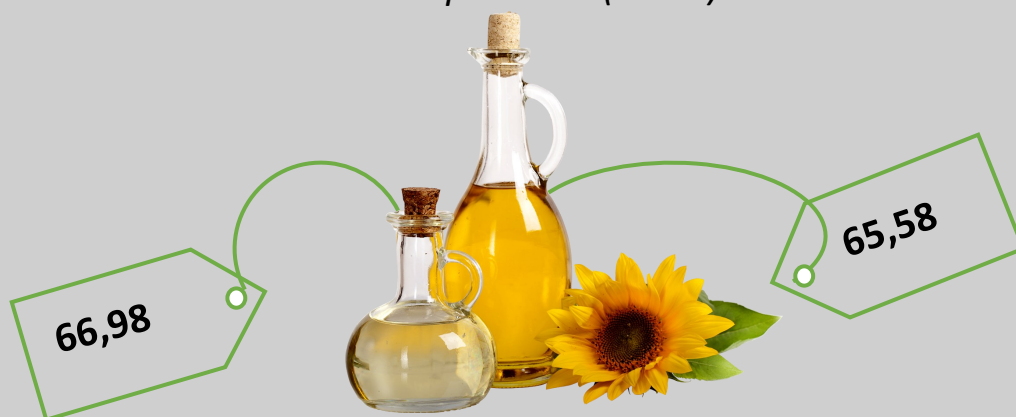
Олія соняшникова (1 л)