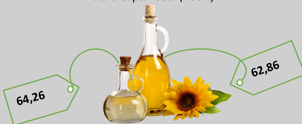
Олія соняшникова (1 л)