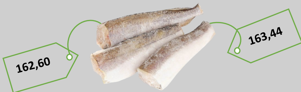
Риба морожена (кг)