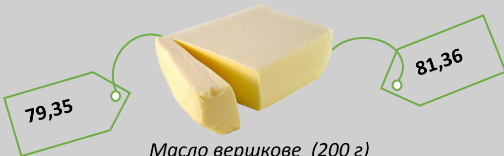
Масло вершкове (200 г)