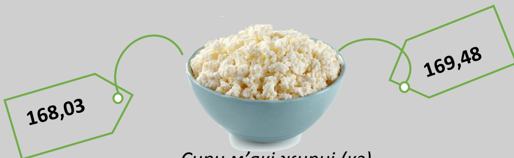
Сири м'які жирні (кг)