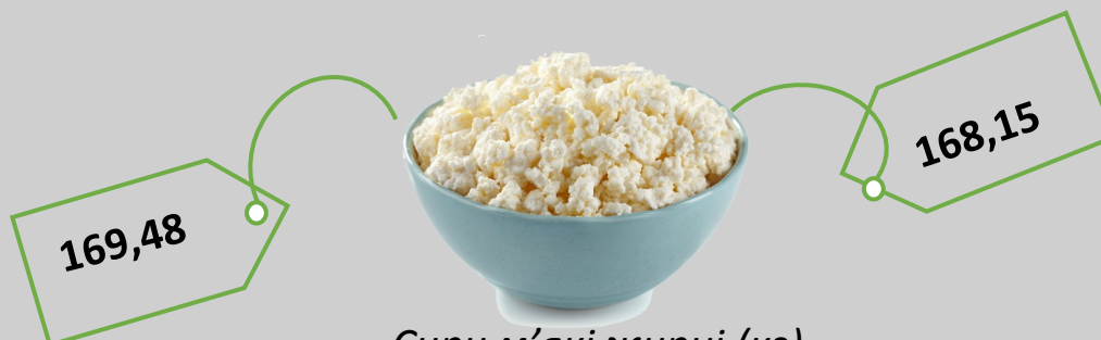
Сири м'які жирні (кг)